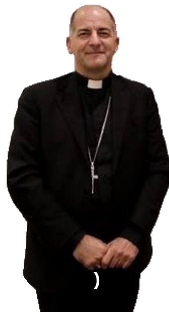
Arcivescovo GIAMPIETRO DAL TOSO , Presidente delle Pontificie Opere Missionarie

«Questo Fondo ha lo scopo di sostenere la presenza della Chiesa nei territori di missione, che subisce anche le conseguenze del Corona Virus. Attraverso l'attività della Chiesa di predicare il Vangelo e di aiutare concretamente attraverso la nostra vasta rete, possiamo dimostrare che nessuno è solo in questa crisi. In questo senso, le istituzioni e i ministri della Chiesa svolgono un ruolo vitale. Questa è l'intenzione del Santo Padre nel costituire questo Fondo. Mentre così tante persone stanno soffrendo, ricordiamo e raggiungiamo coloro che potrebbero non avere nessuno che si prenda cura di loro, mostrando così l'amore di Dio Padre. Chiedo alla nostra rete delle Pontificie Opere Missionarie, presenti in ogni diocesi di tutto il mondo, di fare il possibile per sostenere questa importante iniziativa del Santo Padre».