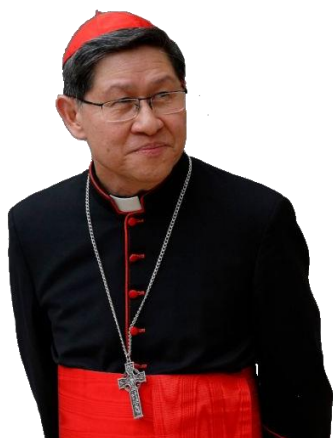
Cardinale LUIS ANTONIO G. TAGLE , Prefetto della Congregazione per l'Evangelizzazione dei Popoli

I contributi possono essere versati anche al conto: VA31001000000040286004 (SWIFT/BIC: IOPRVAVX) (€) VA04001000000040286005 (SWIFT/BIC: IOPRVAVX) (USD $) intestato all'Amministrazione delle Pontificie Opere Missionarie, indicando: Fondo Corona-Virus