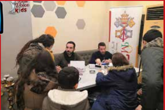
Les candidatures on pu être soumises du 18 au 22 janvier 2021.