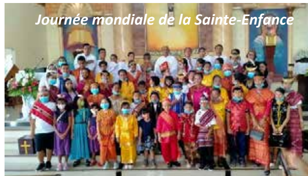
Journée mondiale de la Sainte-Enfance