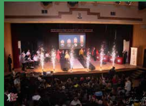
Clip link: https://fb.watch/aPs3R4-458/

Nous nous verrons demain, sûrement avec un nouveau rêve, la main dans la main pour recommencer.