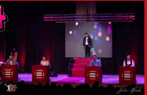
La première représentation a eu lieu le 12 février 2021. Sur les 27 participants, seuls 19 ont été choisis pour la deuxième émission.