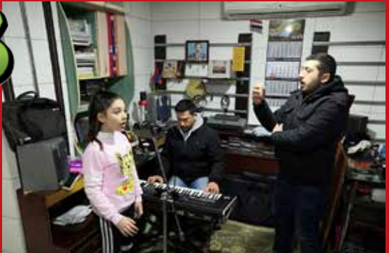
Du 1er au 11 février, une période de formation a été organisée pour les candidats sélectionnés, qui ont appris les chansons qu'ils allaient ensuite chanter sur scène devant le jury.