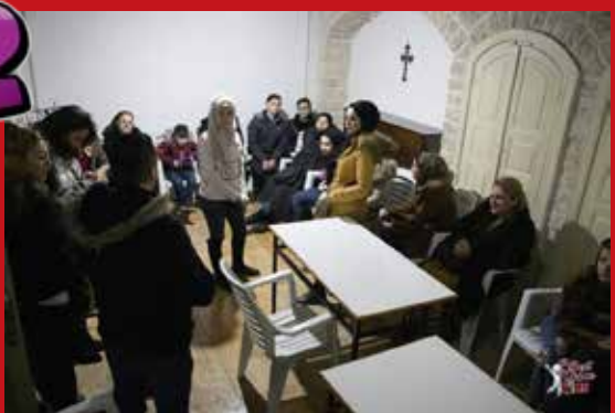
28 janvier 2021 : première audition. Sur les 72 candidats, 27 ont été choisis pour participer à l'émission en direct sur scène.