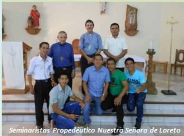
Seminaristas Propedéutico Nuestra Señora de Loreto